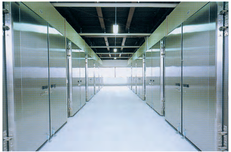
観音扉（バナナ熟成庫） Double-leaf swinging doors (banana maturing storage)