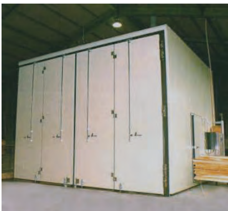
木材乾燥庫用四枚折扉 Four-leaf folding doors for wood drying storage

This door package was developed to maximize the opening. When opened, the pair of leaves on each side are structured to fold. The leaves occupy only half of the space of the doors when opened and closed, making effective use of available space.